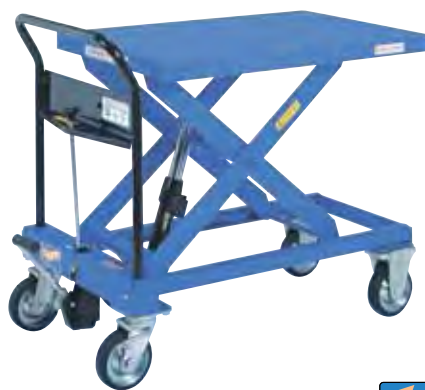
急降下防止バルブ付