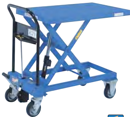
急降下防止バルブ付