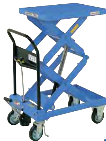
急降下防止バルブ付