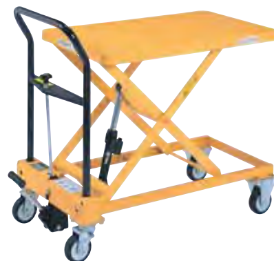
急降下防止バルブ付