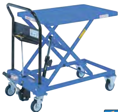
急降下防止バルブ付