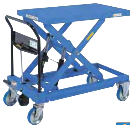
急降下防止バルブ付