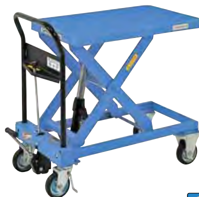
急降下防止バルブ付