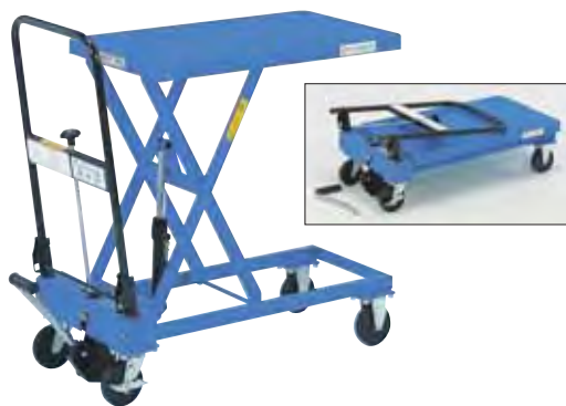
ハンドル折りたたみ式