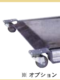
前輪旋回キャスター